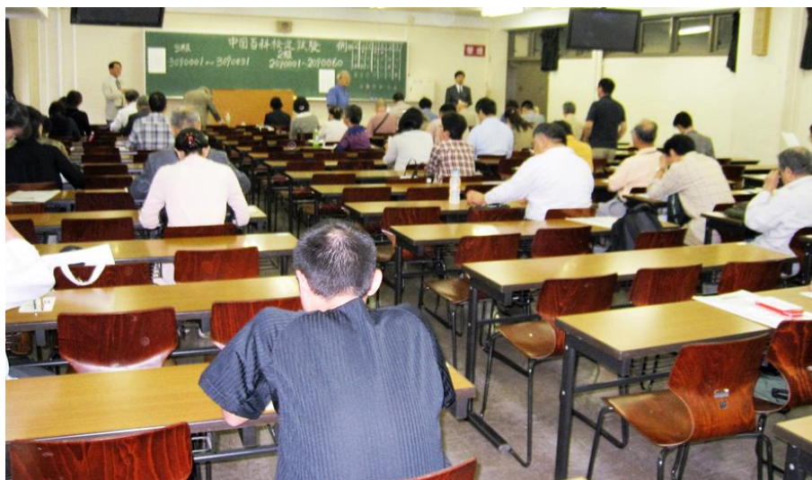
第2回中国百科検定試験の東京会場